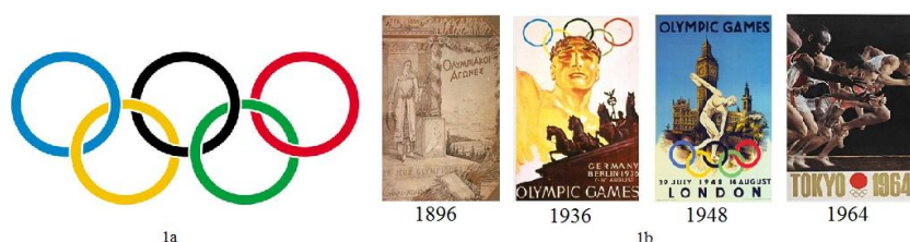
Figura 1 – 1a) Símbolo da bandeira olímpica 1b) Cartazes de divulgação das Olimpíadas Modernas

A bandeira olímpica apresenta um fundo branco com cinco anéis entrelaçados no centro da mesma, representando os continentes do mundo. Este entrelaçamento entre os anéis caracteriza os princípios do Olimpismo como o espírito olímpico, a ética esportiva e a união através do esporte. As cores utilizadas, incluindo o fundo branco, constituem as bandeiras dos países existentes até o momento da realização dos primeiros Jogos Olímpicos da Era Moderna. Destacamos também alguns símbolos que caracterizam as Olimpíadas Modernas, como a existência da tocha olímpica, surgindo primeiramente nos Jogos Olímpicos realizados no ano de 1936; o hino olímpico apresentado ao público no ano de 1960; o lema citius-altius-fortius que significa mais rápido, mais alto e mais forte, desenvolvido com a intenção de encorajar os atletas para a competição; e os cartazes de divulgação que apresentam imagens características do país-sede do evento (Figura 1b).